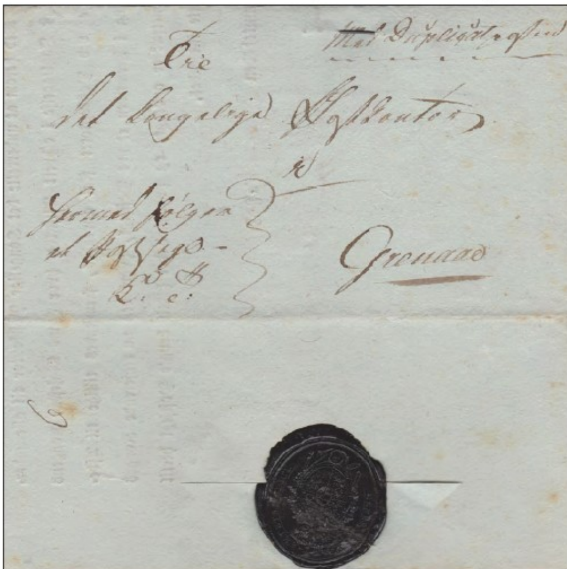
Figur 1: Brevet har i øverste højre hjørne dirigerings påtegningen "Med Dupliqatposten" og i nederste venstre hjørne "Hermed følger et Postsegl K. T.", og på bagsiden karte nummer "6" og General Postamtets segl i sort lak. Det sorte "sørgelak" skyldes kong Kristian VII død dagen før, altså den 13. marts 1808, og skulle bruges i et 1/2 år efter kongens død. Brevet er et Circulaire dateret den 14. marts.

Dansk Posthistorisk Leksikon definition af duplikatforsendelser er som følger: