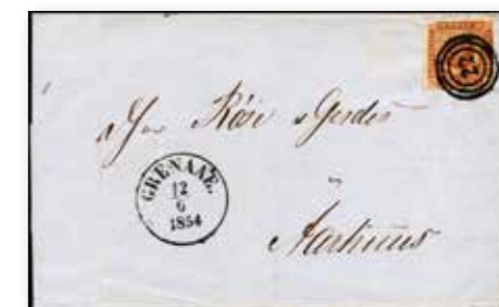
Nummer- og Grenaa-dagstempel på landsportobrev af 1. vægtklasse sendt fra Grenaa til Aarhus 12. juni 1854.

I 1845 fik Grenaa samtidig med over 100 andre byer i kongeriget og her-tugdømmerne tildelt et dagstempel med byens navn. Indførsel af dags-templerne med afsenderbyernes navn og datoer for afsendelserne indfør-