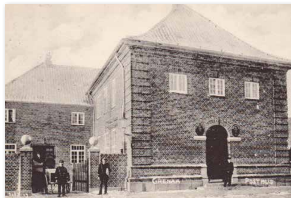
Grenaa Post- og Telegrafbygning opført 1908-1909.

nomi overtog Statsbanerne (DSB fra 1885) driften af Østjyske Jernbaner 1. oktober 1881. Ved udvidelsen af Ryomgaard-Gjerrild Banen (RGB), der var startet 5. december 1911, med jernbanestrækningen Gjerrild-Grenaa den 26. juni 1917, fik Grenaa en ny postforbindelse til Norddjursland, og hvor der allerede fra 1. januar 1912 var oprettet bureau. Fra 1. juli 1917 var der dermed også bureau på strækningen Gjerrild-Grenaa.