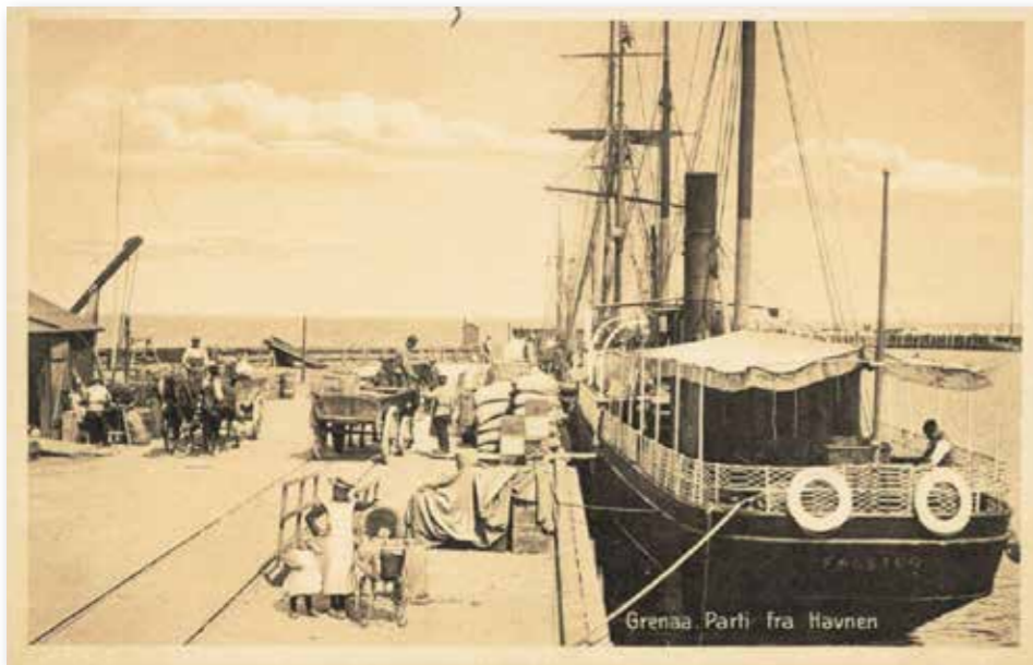
Dampskibet "Falster" i Grenaa havn, der besejlede ruten Grenaa-København.

1851, der var udsendelsesdatoen for Danmarks første frimærke, pålydende 4 rigsbankskilling, hvilket skyldes, at før denne dato blev udelukkende breve til udlandet afstemplet. Fra 1. april 1851 skulle også indenrigs-breve forsynes med dagstempel. De få afstemplinger, der kendes, er alle fra frimærketiden efter 1851. Grenaa-stemplet er kendt brugt frem til maj måned 1874. Den 29. oktober 1852 fik Grenaa tildelt nummerstempel 22, der blev benyttet til sidst i juli måned 1883.