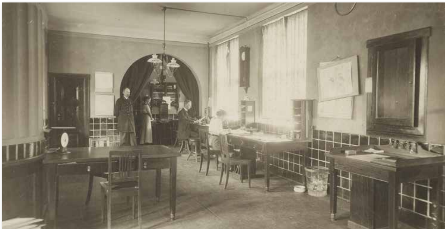
Grenaa Postkontor, 14 september 1914, på bagvæggen ses kort over krigens fronter.

den 1870-1889 var postkontoret dog degraderet til postekspedition.