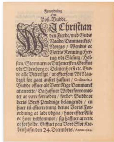
Christian IVs postforordning af 1624.

Af Grenaa's tingbog fremgår, at der den 2. februar 1714 blev oplæst en kongelig forordning, der gik ud på, at intet brev måtte sendes til noget sted