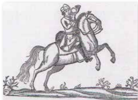
Træsnit af dansk posttrytter fra 1752.

heste, og derfra stammer navnet Posthaven. Senere, men inden 1846, bortfaldt denne ret, og Posthaven blev udlejet til en af byens borgere på livstid for en årlig afgift til kærnerkassen. I 1896 var lejen 35 kroner om året, dog med den anmærkning, at lejeren skulle finde sig i at afgive pladsen til dyrskue, når dette forlangtes, og at ingen del af arealet måtte opdyrkes. Det angives udtrykkeligt i en forhandling mellem byfogeden og otte af byens "bedste borgere" i 1772, at pladsen benævnes Posthaven, og at den fra ældre tid har været udlagt til græsning for postheste, og at den også i fremtiden skulle vedblive dermed.